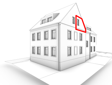
SCHÉMA UMÍSTĚNÍ APARTMÁNU