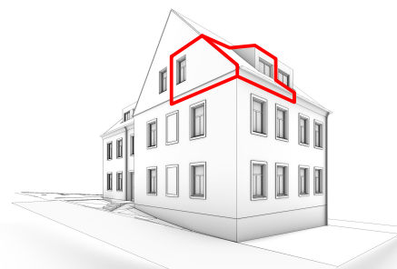
SCHÉMA UMÍSTĚNÍ APARTMÁNU